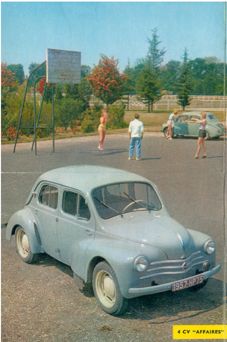
4 CV "AFFAIRES"