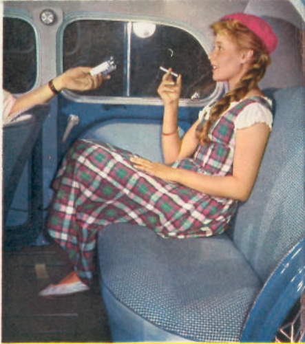
4 CV "SPORT"

sont difficiles quand il s'agit de leur voiture. Cette année, la 4 CV a renouvelé sa garde-robe. Voiture jeune et toujours moderne, elle s'habille « gai et pratique ». Le drap cannelé (modèle Sport) ou quadrillé (modèle Affaires) est assorti aux teintes de la carrosserie.