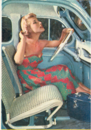
4 CV "AFFAIRES"

Le supplément de prix très modéré est largement justifié par un plaisir nouveau de conduire et par la « protection » des organes mécaniques contre toute maladresse.