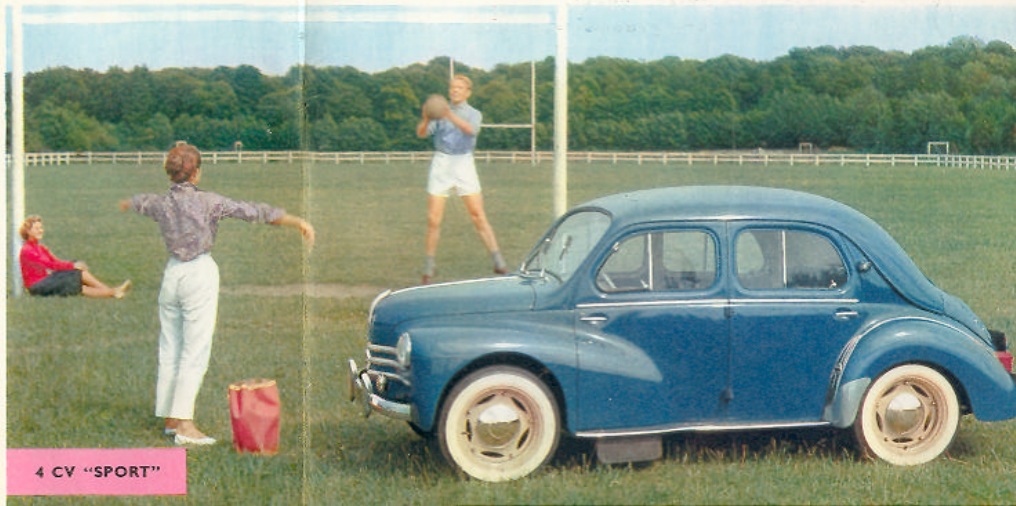
4 CV "SPORT"

Les déflecteurs des glaces avant et les glaces arrière coulissantes, assurent une aération excellente.